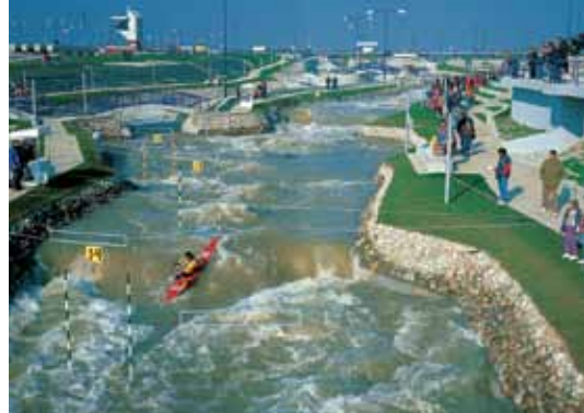
13 Aire de sports nautiques Bratislava-Čunovo Centro di sport acquatici