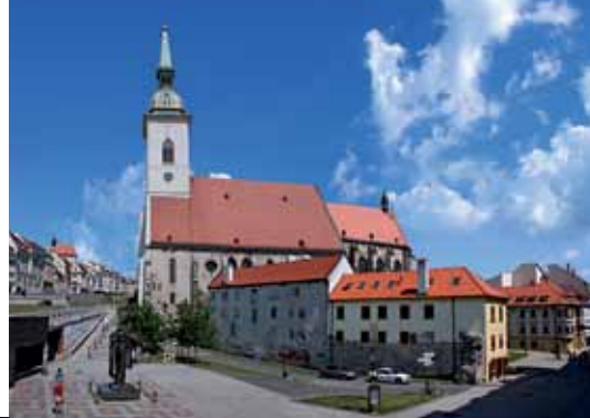
3 Cathédrale Saint-Martin Bratislava Duomo di S. Martino