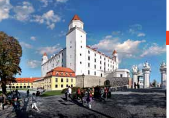
1 Château de Bratislava Bratislava Castello di Bratislava