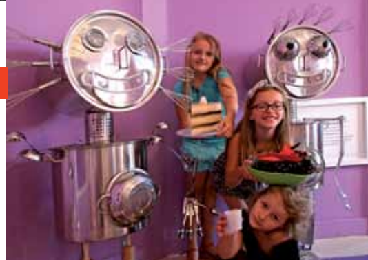
7 Galerie nationale slovaque Bratislava Galleria Nazionale Slovacca