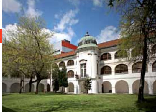
8 Théâtre national slovaque Bratislava Teatro Nazionale Slovacco