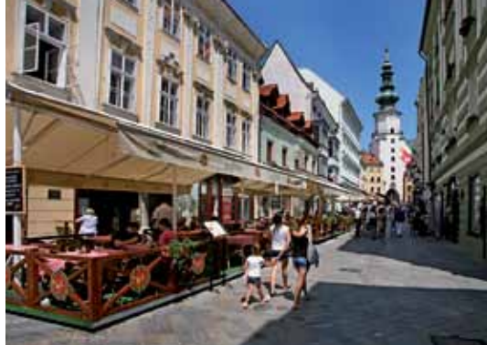
4 Tour Michel Bratislava Torre di S. Michele