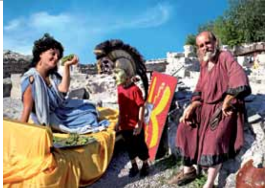
14 Gerulata - Musée de l'Antiquité romaine Bratislava-Rusovce Gerulata - Museo dell'antichità romana