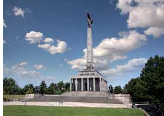
5 Mémorial de Slavín Bratislava Monumento Slavín