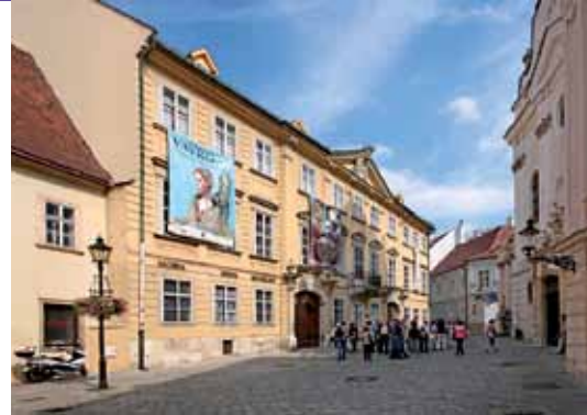
12 Galerie de la Ville de Bratislava Bratislava Galleria della città di Bratislava