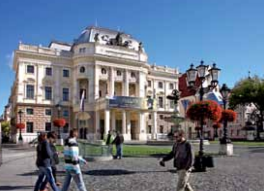
9 Théâtre national slovaque Nouveau bâtiment Bratislava Teatro Nazionale Slovacco - nuova costruzione