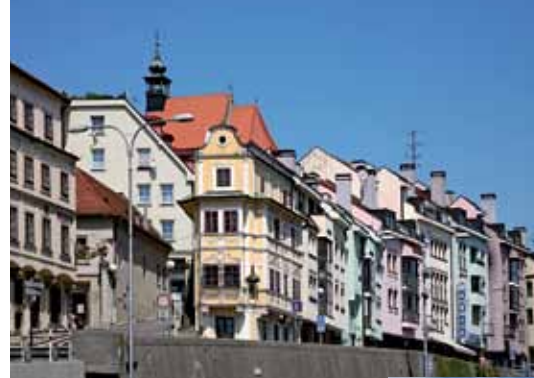
2 Maison du Bon Pâtre Bratislava Casa del Buon Pastore