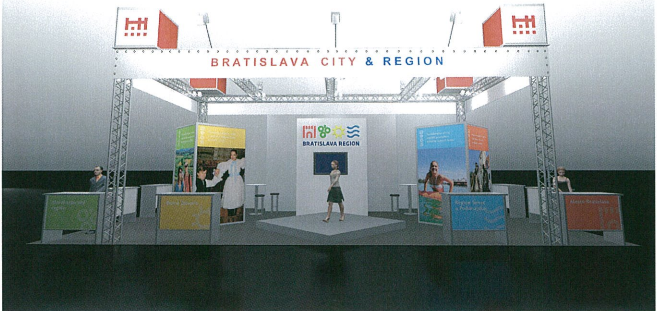
Grafika je ilustračná