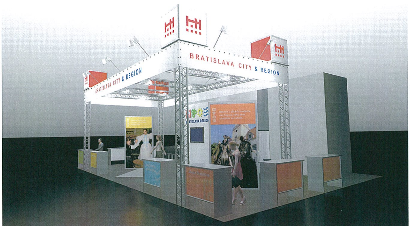
Grafika je ilustračná

Návrh expozície destinácie Bratislavský región na veľtrhu