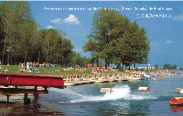
Recinto de deportes y relax de Zlaté piesky (Arena Dorada) de Bratislava 金沙湖娱乐休闲区

Si de la presente oferta no han escogido nada, tenemos otras ideas. El zoológico con el primer Parque de Dinosaurios – Dinopark – eslovaco, para los amigos de los caballos invitamos al hipódromo en Petržalka con un calendario lleno de concursos hípicas. En varios clubes por la orilla de la ciudad podrá montar a caballo. También visiten el Jardín de Janko Kráľ, uno de los parques públicos más antiguos de Europa, en la ribera derecha del Danubio. Durante el verano su playa urbana está inundada por una estupenda atmósfera de vacaciones y por todo que conlleva el descanso, el deporte y la diversión.