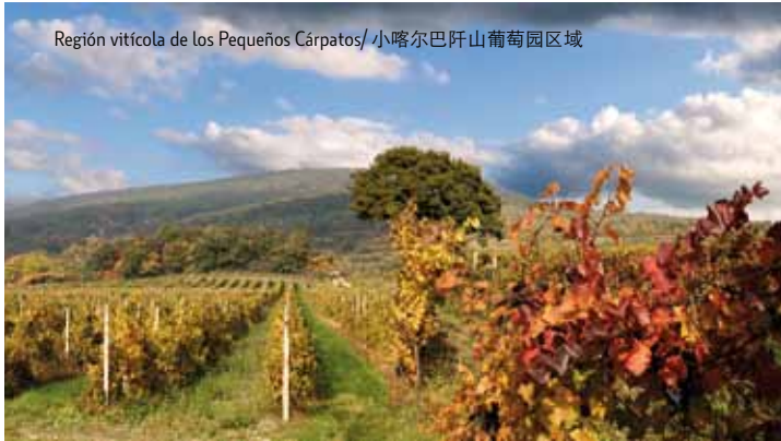
Región vitícola de los Pequeños Cárpatos/小喀尔巴阡山葡萄园区域