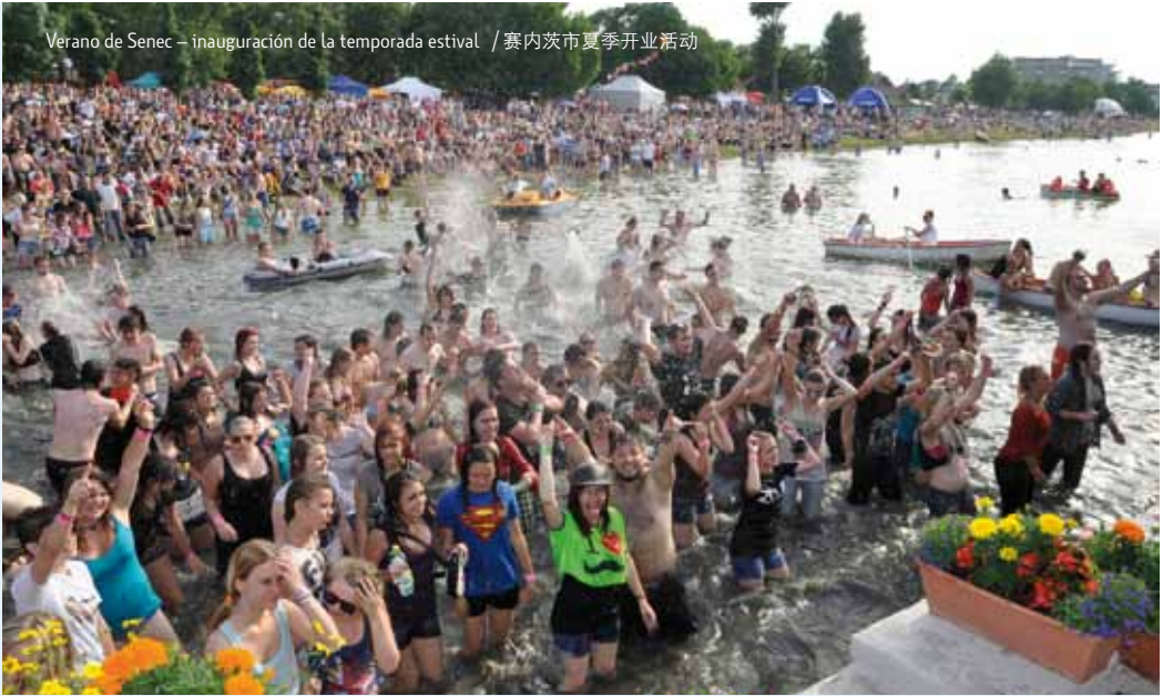
Verano de Senec – inauguración de la temporada estival / 赛内茨市夏季开业活动