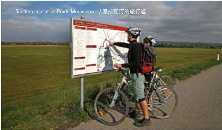
Sendero educativo Prado Moraviense / 摩拉瓦河的旅行道