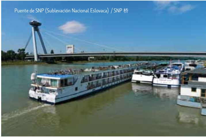
Puente de SNP (Sublevación Nacional Eslovaca) / SNP 桥