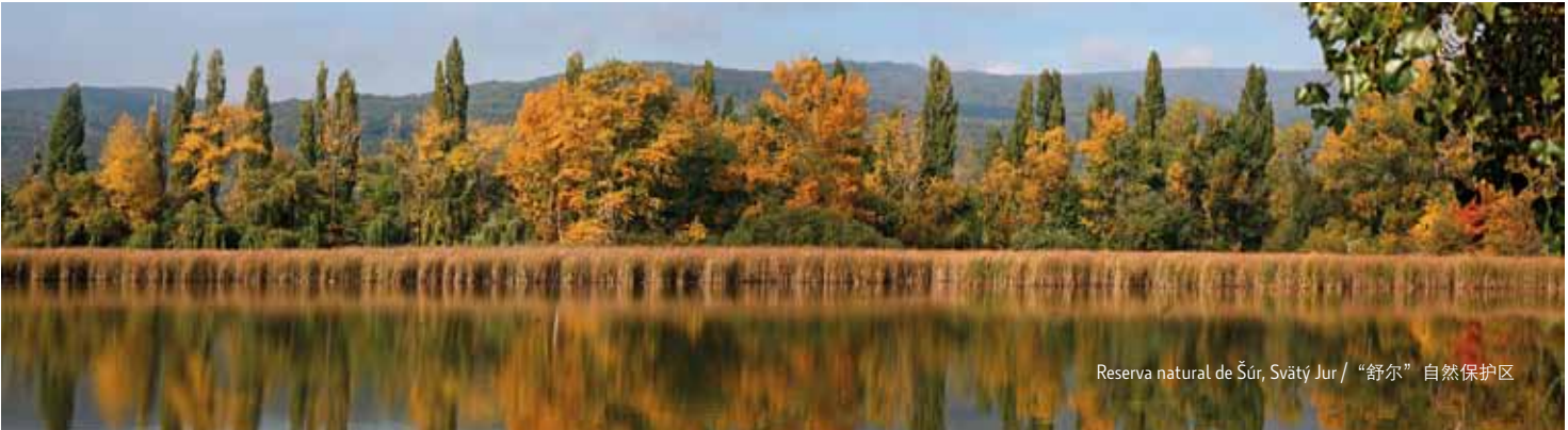
Reserva natural de Šúr, Svätý Jur / “舒尔”自然保护区