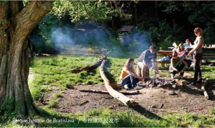
Parque bosque de Bratislava / 布拉迪斯拉发市森林公园