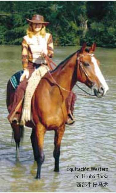
Equitación Western en Hrubá Borša 西部牛仔马术