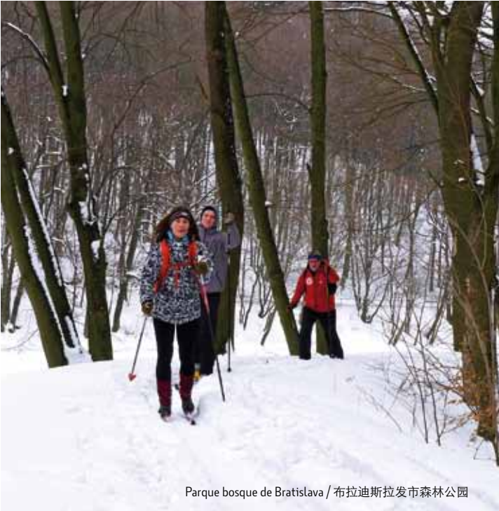
Parque bosque de Bratislava / 布拉迪斯拉发市森林公园

www.tourismbratislava.com www.region-bsk.sk www.visit.bratislava.sk www.tikdnv.sk