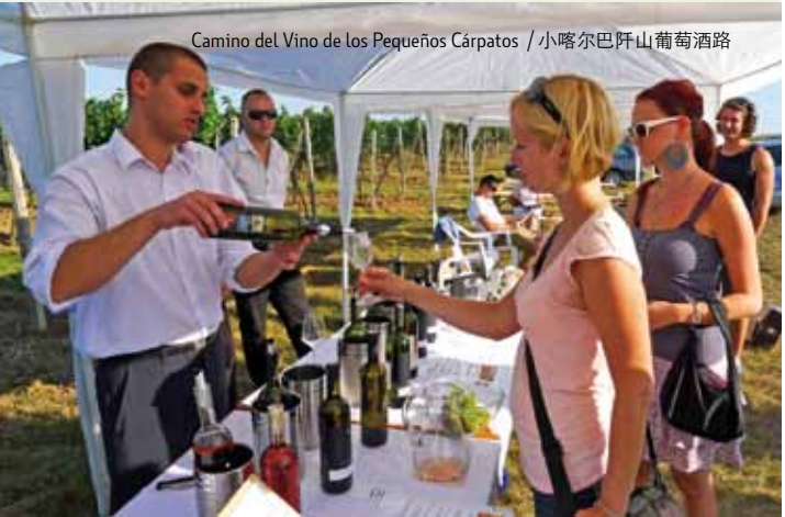
Camino del Vino de los Pequeños Cárpatos / 小喀尔巴阡山葡萄酒路

在莫德拉市附近，有一间隐藏在橡树林，坐落于山上，独特而有时尚的Zochová chata度假酒店和一家具有传统风格的Furmanská krčma餐馆。酒店提供舒适的住宿和疗养服务。餐馆提供传统斯洛伐克菜，值得一提的是野味特色菜和本地高级葡萄酒。这里的滑雪中心叫Piesok，适合父母和孩子一起滑雪。夏天，可以坐在内环划水圈上划水。穿上旅游鞋，从酒店出发花大概一个小时可以达到Velká homola（海拔709.2 米）山上的旅游观察塔。在6层高的旅游塔那有令人难忘的美丽自然风光和令人印象深刻的小喀尔巴阡山地区的全貌。