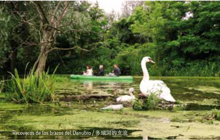
Recovecos de los brazos del Danubio / 多瑙河的支流

如果很难选择，我们还有其它建议：布拉迪斯拉发动物园里的恐龙公园，喜欢马的可以去贝德勒绕卡 (Petržalka) 区塞马场看赛马或去郊区骑马。多瑙河右岸的Sad Janka Kráľa公园是中欧最古老的公园，夏天会设一个晒太阳区，在那里可以休息，运动和参加派对。