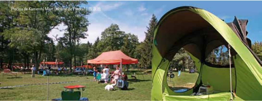
Piscina de Kamenný Mlyn (Molino de Piedra) / 游泳池