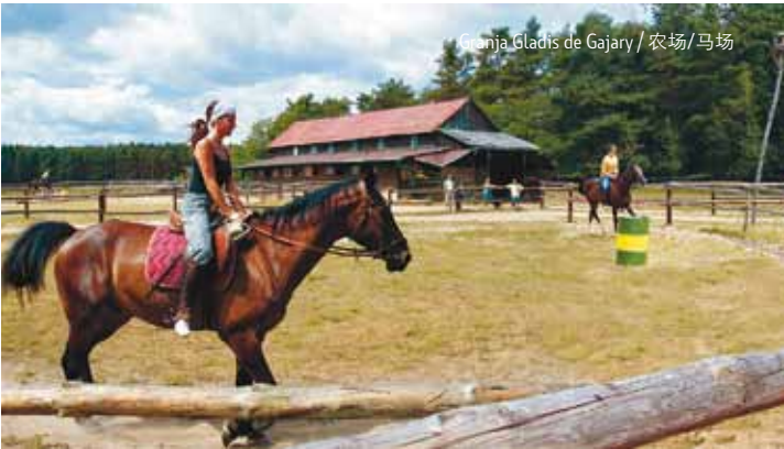
Ranč Gladis de Gajary / 农场/马场

¿Ya se han bañado en una biopiscina? ¿Rodeada de nenúfares blancos florecientes, basada en depuración natural sin productos químicos, con calentamiento natural? No deje perder esta experiencia. Esta piscina en Kamenný Mlyn entre Stupava y Malacky es un recinto estival popular a la sombra de pinos con un hotel, camping, restaurante y campos deportivos. Y sólo a unos kilómetros de la zona de recreo Rudava cerca de Malé Leváre. En su recinto se puede acampar, nadar en el lago minero con playas arenosas, hacer surf, ir en barca, practicar deportes de playa, pasar un rato por la noche con parrillada o bailar en discoteca. Durante las vacaciones Rudava se llena de distintos eventos de diversión.