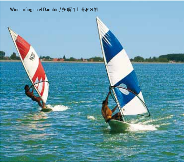
Windsurfing en el Danubio / 多瑙河上滑浪风帆