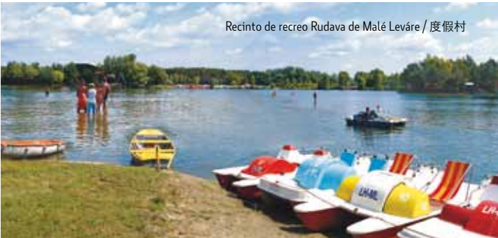
Recinto de recreo Rudava de Malé Leváre / 度假村

Vastos bosque de pino sobre arenas movedizas, lagos naturales con playas arenosas, terrazas fluviales en la vega del río Morava, – así es el relieve del paisaje de Záhorie Un destino atrayente para pasar las vacaciones estivales. Los bosques frondosos de los Pequeños Cárpatos con indicación de las rutas turísticas sobretodo atraen a los que practican turismo de caminatas y los buscadores de setas, y los estanques de Záhorie a los entusiastas de la pesca. Pero Záhorie sobretodo es el paraíso de cicloturismo. Las rutas ciclistas a Lozorno llevan por los caminos forestales de Železná studnička – el parque bosque de Bratislava, desde donde los más perseverantes podrán continuar a través de los viñedos de los Pequeños Cárpatos a Rača y Svätý Jur. Las familias con niños podrán salir de excursión en bicicleta por la cuenca del río Morava y juntos alegrar la vista con el paisaje pintado por la naturaleza. También déjense seducir por la navegación en el río Morava, por ejemplo de Moravský sv. Ján, disfrutar un picnic en Záhorská Ves o Vysoká na Morave. Si vistan el Ranč u Indiánky (Rancho de la Indiana) de v Malacky, pasarán un día en armonía con la naturaleza. Aquí hay una amplia casa de fieras natural, se puede montar a caballo o pony.