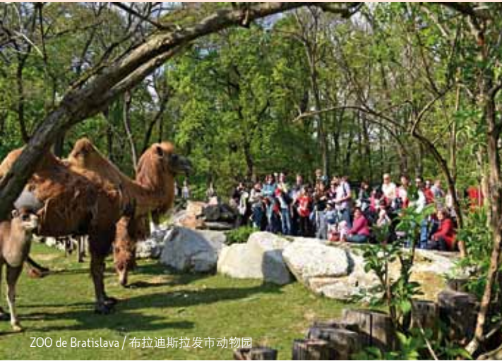
ZOO de Bratislava / 布拉迪斯拉发市动物园