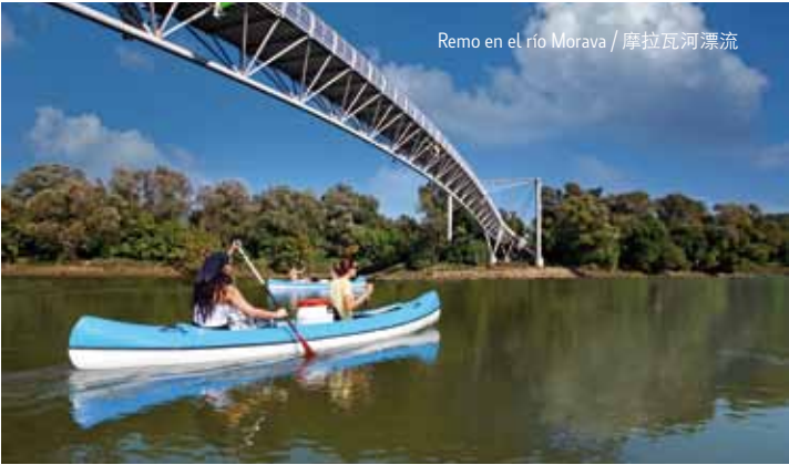
Remo en el río Morava / 摩拉瓦河漂流