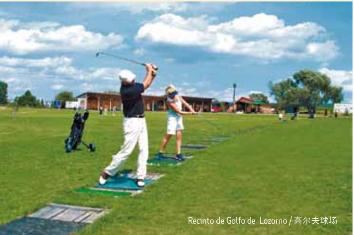
Recinto de Golfo de Lozorno / 高尔夫球场