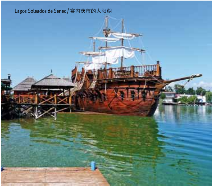
Lagos Soleados de Senec / 赛内茨市的太阳湖