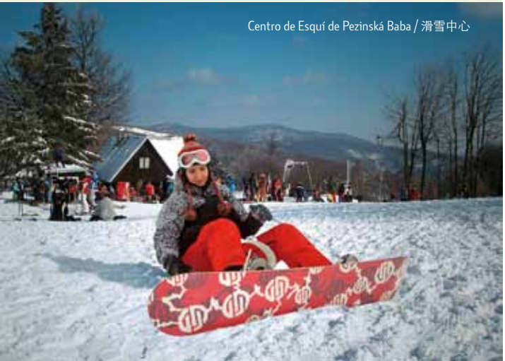
Centro de Esquí de Pezinská Baba / 滑雪中心