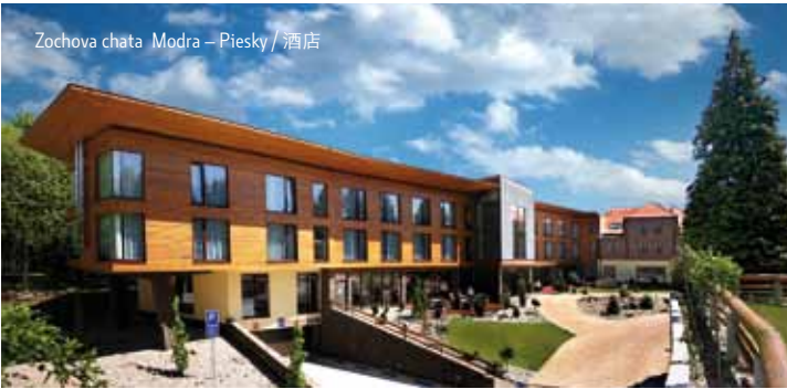
Zochová chata Modra – Piesky / 酒店