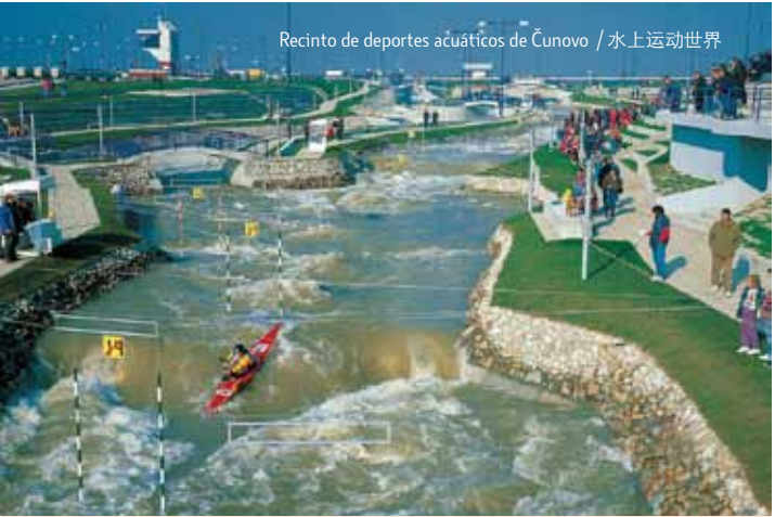
Recinto de deportes acuáticos de Čunovo / 水上运动世界