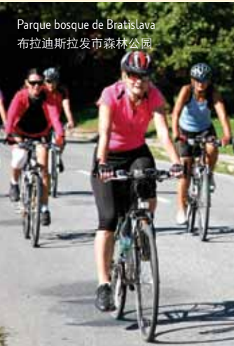
Parque bosque de Bratislava 布拉迪斯拉发市森林公园

普拉维茨基城堡 (Plavecký hrad) 和百伊斯顿城堡 (Hrad Pajštún) 的废墟充满着神秘。爬到百伊斯顿城堡需要花点力气但是这里的风景绝对值得，天晴的时候可以看到阿尔卑斯山。百伊斯顿城堡全年都能看到攀岩爱好者在城堡岩攀岩，用不同的颜色来表示路线的的攀岩难度。现在高尔夫在察霍里越来越流行。马拉茨基的Eurovalley 高尔夫公园有27洞球场。Lozorno的Pegas高尔夫俱乐部也有属于自己的场地。