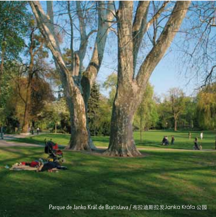
Parque de Janko Kráľ de Bratislava / 布拉迪斯拉发Janka Kráľa 公园

www.lod.sk www.divokavoda.sk www.vitajtecyklisti.sk www.intercamp.sk