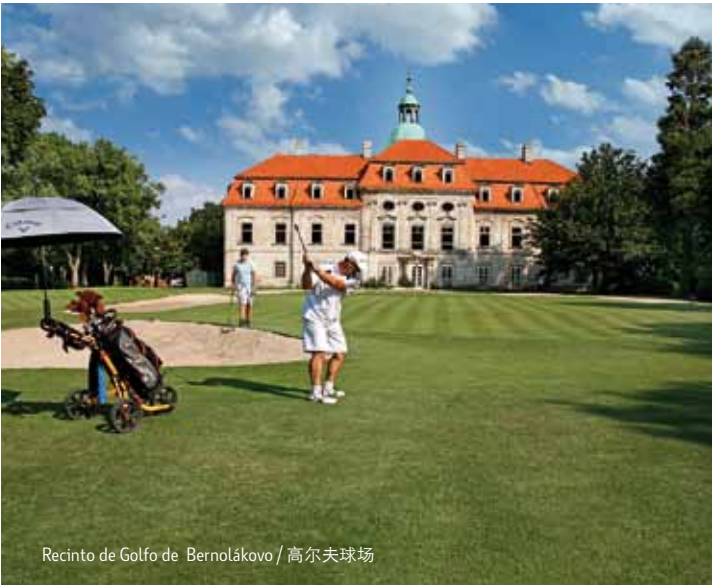
Recinto de Golfo de Bernolákovo / 高尔夫球场

La región del Danubio es la región de silencio, infinita llanura, valiosos bosques de ribera. Salga a navegar por los meandros románticos del Pequeño Danubio durante varios días, atravesando por la llanura infinita de Žitný ostrov (Isla de Trigo), que atraviesa el sendero ciclista de recreo de Hamuliakovo a Senec. En Hamuliakovo en el embalse de Hrušovská se puede conectar al popular camino ciclista danubiano. En Bernolákovo podrá jugar al golf en el ambiente atractivo del castillo barroco en un campo de golf de 18 hoyos, en el pueblo de Hrubá Borša está edificada la academia de golf de 9 hoyos. El Pilot Club de Kráľová pri Senci se ocupa de proporcionar experiencias excitantes con sus aviones deportivos y globos aerostáticos de aire caliente, o con el motocross de Dunajská Lužná y Lehnice. También podrá disfrutar la sala de karting cubierta de Ivanka pri Dunaji. La equitación está unida con esta región desde tiempo inmemorial. El encanto de este pasatiempo se puede probar en varios pueblos, En Bernolákovo – el salto ecuestre, Hrubá Borša la equitación tradicional western, en Chorvátsky Grob excursiones en carros tirados por dos caballos.