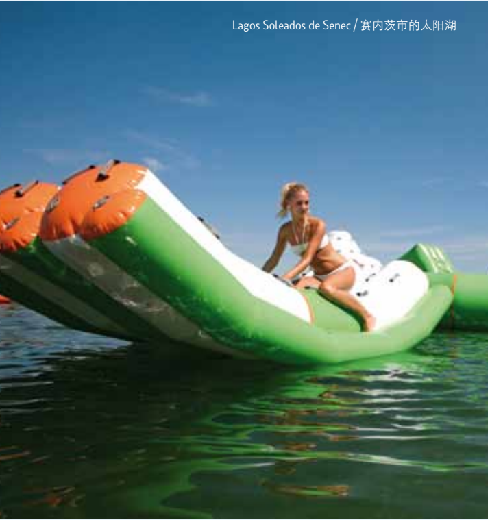
Lagos Soleados de Senec / 赛内茨市的太阳湖

多瑙河区域也有无边无垠的多瑙河流域盆地和有特色的河岸森林。游客可以参加几天的小多瑙河漂流或可以从赛内茨市骑自行车（有专门的自行车道）到Hamuliakovo。在Hrušov水库可以上多瑙河自行车道。Bernolákovo村的巴洛克风格宅邸后院有18洞高尔夫球场。Hrubá Borša村建立了9洞高尔夫球场学校。Pilot Club（飞行员俱乐部）在Kráľová pri Senci村提供很刺激的飞行体验。可以坐小型运动飞机或者热气球。Dunajská Lužná和Lehnice村举办摩托车越野活动。在Ivanka pri Dunaji村可以玩室内卡丁车。多瑙河区域有很长的骑马历史，现在很多人对养马骑马有浓厚的兴趣。很多村子可以提供骑马场地。比如说Bernolákovo有障碍超越，Hrubá Borša有西部传统牛仔马术，Chorvátsky Grob有马车可以提供乘坐。