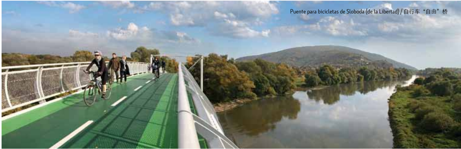
Puente para bicicletas de Sloboda (de la Libertad) / 自行车“自由”桥