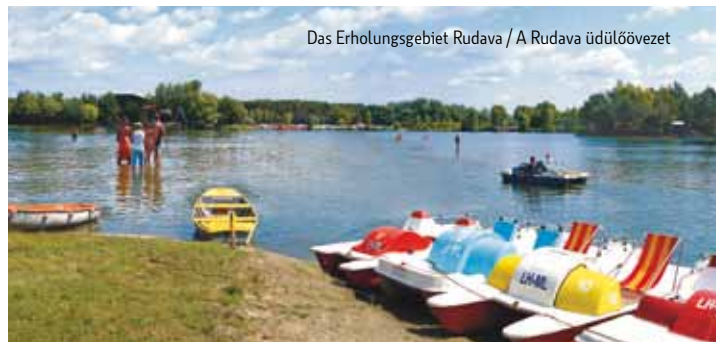
Das Erholungsgebiet Rudava / A Rudava üdülıővezet

Ein Hauch von Geheimnis und Geschichte umweht den Besucher bei den Ruinen der Burg Blasenstein (Plavecký hrad) oberhalb der Gemeinde Blasenstein (Plavecké Podhradie) und auf dem Ballenstein (Pajštún) oberhalb von Ballenstein (Borinka). Der Aufstieg auf den Ballenstein ist ein wenig anstrengend, aber die Anstrengungen lohnen sich. Vor uns eröffnet sich das unbeschreibliche Panorama der Landschaft, bei guten Sichtverhältnissen auch bis zu den Gipfeln der Alpen. Interessant an der Burg sind die Renaissance-Maskarone, die „Ballensteiner Löwen“. Das sind Konsolen, die seinerzeit die heute nicht mehr erhaltenen Erker trugen. Am Ballenstein trainieren ganzjährig Freikletterer, die Wand des Burgwalls ist mit farbigen Haken je nach Schwierigkeitsgrad der Route markiert. Der immer populärer werdende Golfsport ist auch in Marchauen beliebt. Kommen und spielen Sie auf dem 27-Loch-Golfplatz Eurovalley Golf Park in Malatzka, oder zum Golf Club Pegas in Losorn.