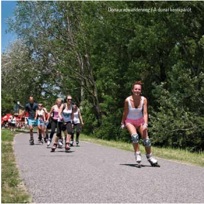
Donauradwanderweg / A dunai kerékpárút