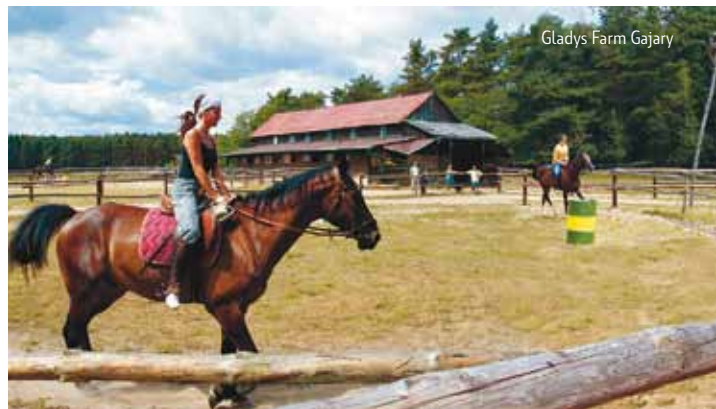
Gladys Farm Gajary