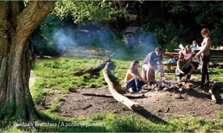
Waldpark Bratislava / A pozsonyi parkerdő