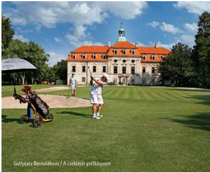
Golfplatz Bernolákovo / A cseklési golfközpont

Das Donautiefland ist eine Landschaft der Ruhe, der unübersehbaren Niederungen, der wertvollen Auenwälder. Geben Sie sich bei einer mehrtätigen Bootsfahrt den romantischen Mäandern der Kleinen Donau hin, durchfahren Sie die weite Niederung der Schüttinsel, über die der Radwanderweg Gutern (Hamuliakovo) – Wartberg (Senec) führt. Von Gutern erreichen Sie beim Staubecken Hrušov den bekannten Donauradwanderweg. In Lanschütz (Bernolákovo) können Sie in der attraktiven Umgebung des barocken Schlosses auf einem 18-Loch-Golfplatz golfen, in Hrubá Borša ist eine 9-Loch-Golf-Akademie errichtet. Für aufregende Erlebnisse sorgen der Pilot Club in Königseiden (Kráľová pri Senci) mit Sportflugzeugen und Heißluftballons oder Moto-Cross in Dunajská Lužná und Legendorf (Lehnice). Ausoben können Sie sich in der Go-Kart-Halle Pfaffendorf (Ivanka pri Dunaji). Reiten ist diesem Land schon seit eh und je eigen. In mehreren Gemeinden können Sie den Zauber dieses Hobbys erleben. In Lanschütz Parkurreiten, in Hrubá Borša das traditionelle Westernreiten, in Kroatisch-Eisgrub (Chorvátsky Grob) Ausflüge mit Zweispännern.