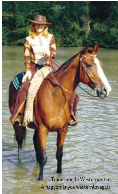
Traditionelle Westernreiten A hagyományos westernlovaglás