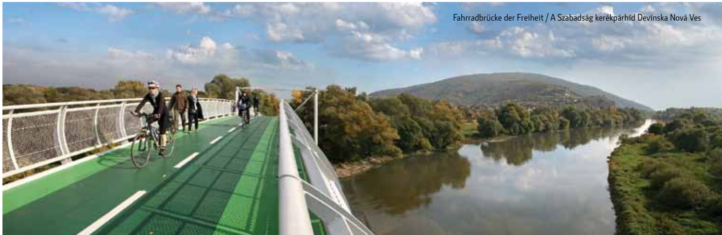
Fahrradbrücke der Freiheit / A Szabadság kerékpárhíd Devínska Nová Ves