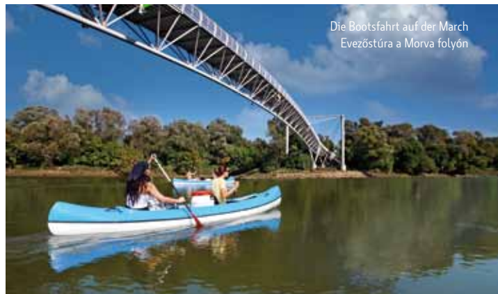
Die Bootsfahrt auf der March Evezőstúra a Morva folyón