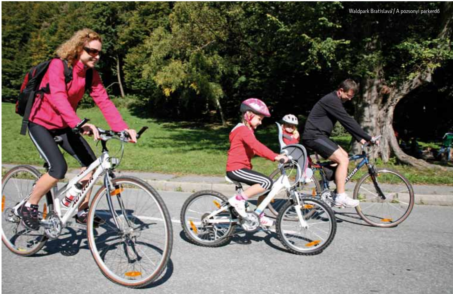
Waldpark Bratislava / A pozsonyi parkerdő