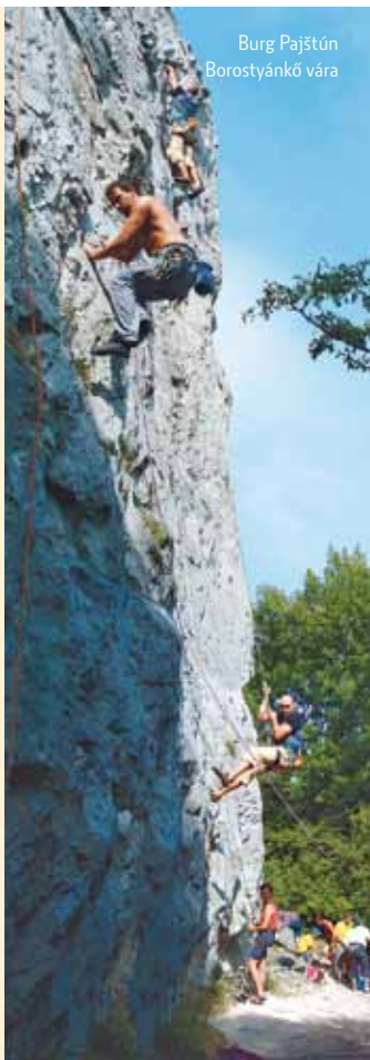
Burg Pajštún Borostyánkő vára