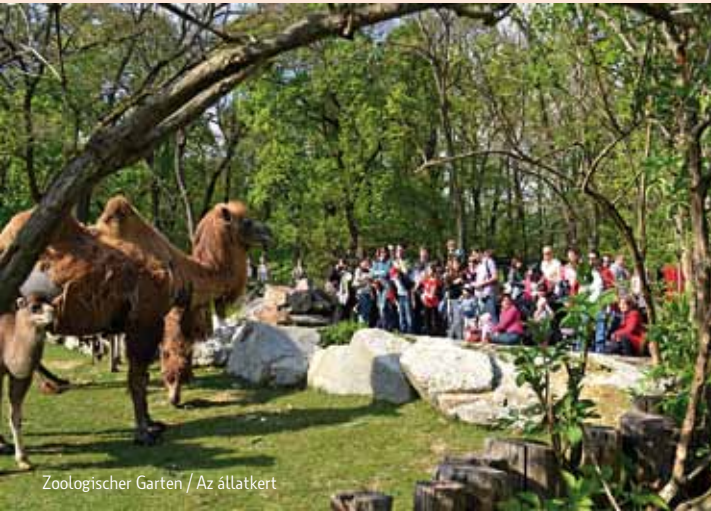
Zoologischer Garten / Az állatkert