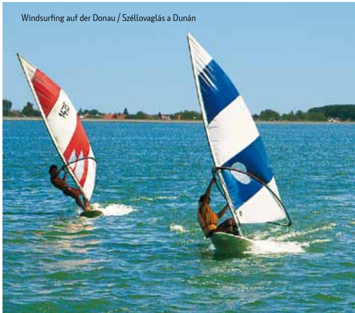
Windsurfing auf der Donau / Széllovaglás a Dunán