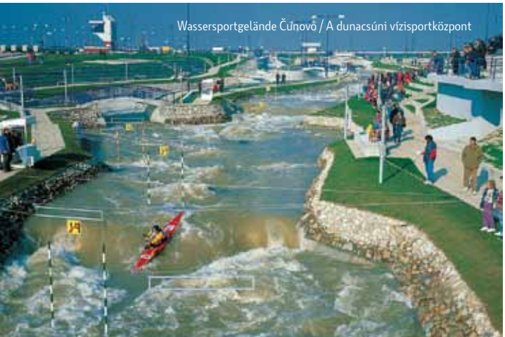
Wassersportgelände Čunovő / A dunacsúni vízisportközpont