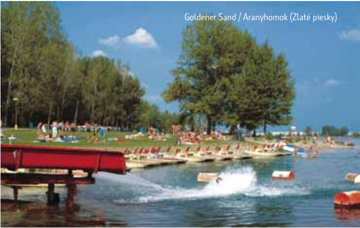
Goldener Sand / Aranyhomok (Zlaté piesky)