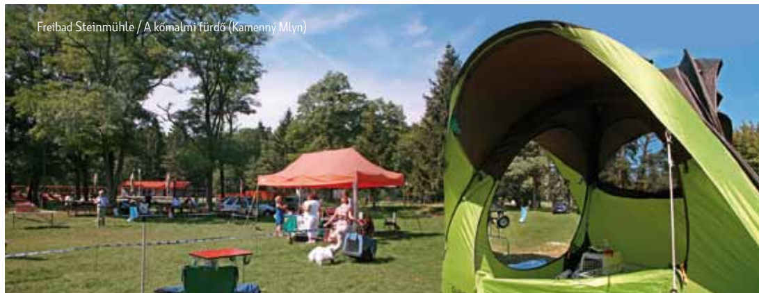
Freibad Steinmühle / A kőmalmi fürdő (Kamenný Mlyn)