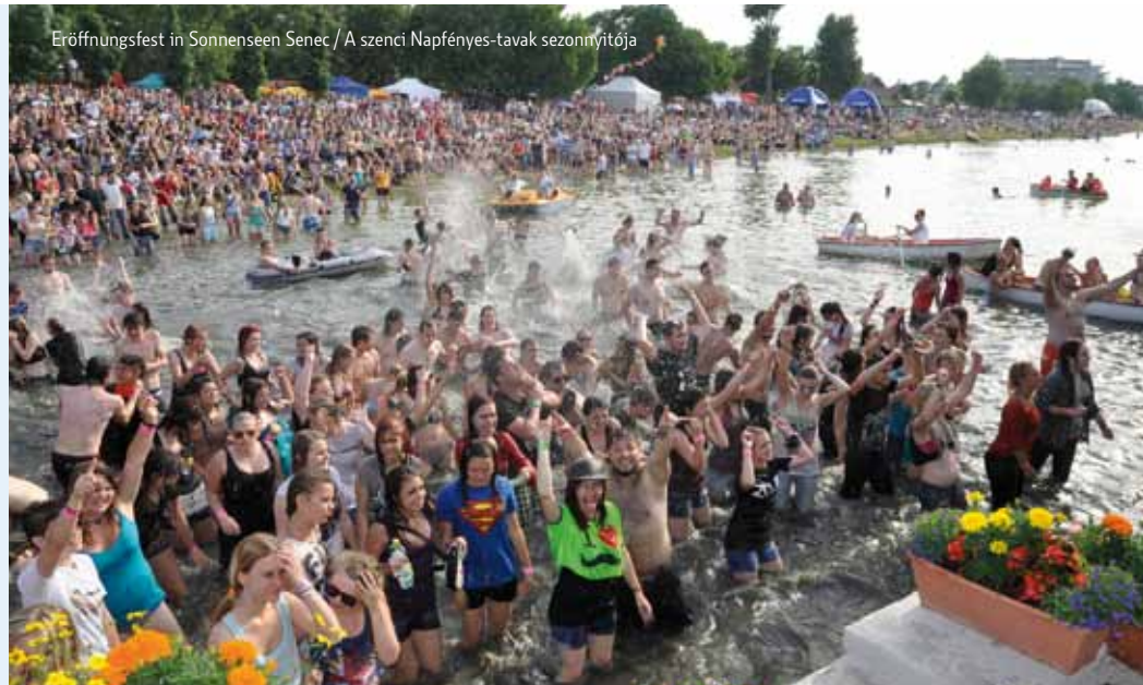
Eröffnungsfest in Sonnenseen Senec / A szenci Napfényes-tavak szezonnyitója