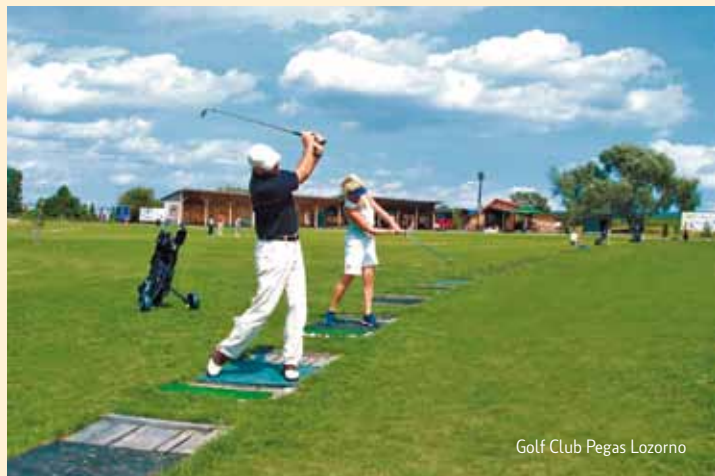
Golf Club Pegas Lozorno