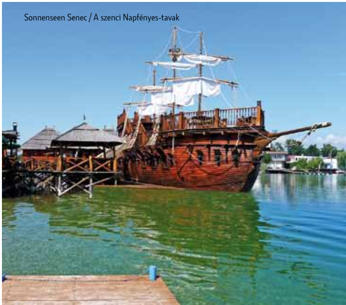
Sonnenseen Senec / A szenci Napfényes-tavak