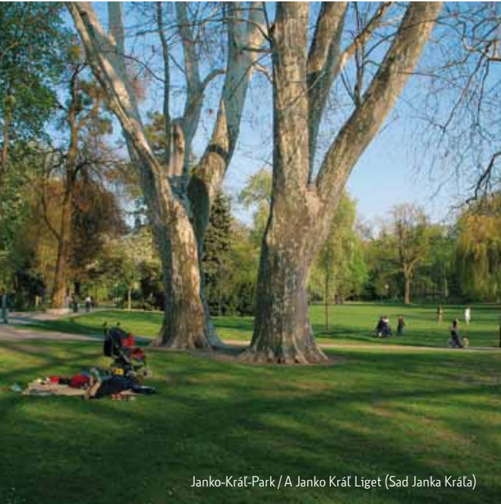
Janko-Král-Park / A Janko Král Liget (Sad Janka Kráľa)

www.lod.sk www.divokavoda.sk www.vitajtecyklisti.sk www.intercamp.sk