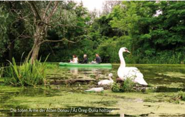
Die toten Arme der Alten Donau / Az Öreg-Duna holtágai

Ha ebből a kínálatból nem tudtak választani, további ajánlataink vannak. Az állatkert, ahol megtekinthetik az első szlovákiai Dínoparkot, a lovak szerelmeseit a gazdag eseménynaplással büszkélkedő ligetfalui lóversenypályára invitáljuk, a lovagolni vágyók a város külterületein működő jó néhány klub valamelyikét választhatják. Látogassanak el a Janko Král Ligetbe (Sad Janka Kráľa), Európa egyik legrégebbi, a Duna jobb partján elterülő nyilvános parkjába. A park városi strandja nyáron remek vakációs hangulatot áraszt, kikapcsolódásra, sportolásra, szórakozásra csábítva mindenkit.