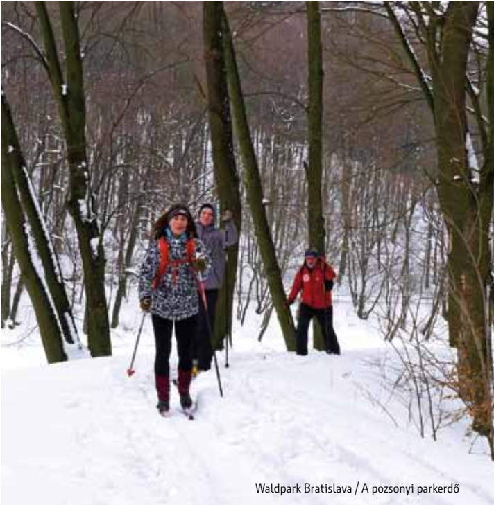
Waldpark Bratislava / A pozsonyi parkerdő

sich an den umliegenden Ständen oder im zweihundert Meter hohen Fernsehturm, auf dem das Drehrestaurant einen Blick auf die ganze Umgebung ermöglicht. Vom Eisenbründl (Železná studnička) führt auch ein Sessellift (Fahrradmitnahme möglich) zum Kamzík. Während der Fahrt können Sie sich an den unbekannten Ausblicken auf das Gebirge der Kleinen Karpaten laben. Eisenbründl ist nur 5 Kilometer vom Stadtzentrum entfernt. Wir empfehlen Ihnen, das revitalisierte Gelände zu besuchen. Es ist ein guter Ort für leichte Spaziergänge, Picknicks. Auf den Waldwegen trainieren Freizeitläufer und Mountainbiker und an den Seen sitzen jagdhungrige Angler. Die markierten Wanderwege führen bis hinauf zum Kammübergang zu den weiteren slowakischen Gebirgen.