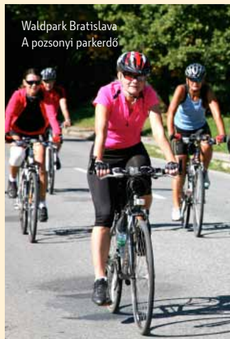
Waldpark Bratislava A pozsonyi parkerdő

A Detrekővárálja (Plavecké Podhradie) fölött álló Detre vára, valamint a Borinka fölött álló Borostyánkő (Pajštún) vára titokzatosságával ragadja meg az oda látogatókat. A Borostyánkő várához vezető út igényes ugyan, de megéri a fáradságot. A vidék leírhatatlanul gyönyörű panorámája tárul elénk, szép időben még az Alpok csúcsait is láthatjuk. Érdekesekek a vár reneszánsz konzolai, a borostyánkői oroszlánok, amelyek a ma már nem létező ablakfülkéket támasztották meg egykor. Borostyánkőn edzenek egész évben a sziklamászók, a sziklán különböző színekkel jelölték ki a nehézségi fokozatokat. Az egyre népszerűbb golfot az Erdőháton is kedvelik. Malackán a 27 lyukú Eurovalley Golf Park és a lozornói Golf Club Pegas várja a sport szerelmeseit.