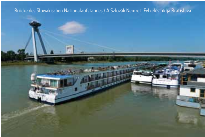
Brücke des Slowakischen Nationalaufstandes / A Szlovák Nemzeti Felkelés hídja Bratislava