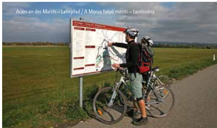
Auen an der March – Lehrpfad / A Morva folyó menti – tanösvény